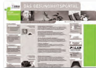
SkyScraper Plus 160 x 600