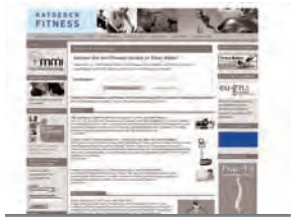
Banner 156 x 60 Rotation