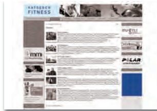
Rubrikenbanner 156 x max. 180