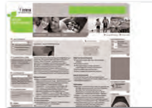
Fullsize-Banner 468 x 60