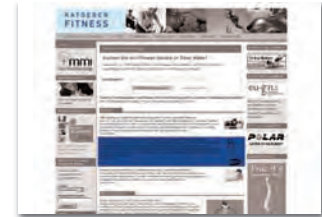
Presstext max. 2.500 Zeichen