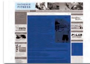
Themenbox 156 x max. 180