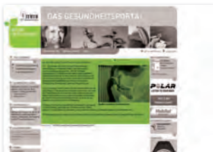
Pressemitteilung max. 2.500 Zeichen