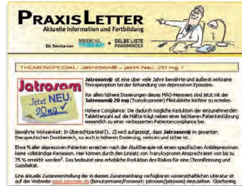
Themen-Spezial klein max. 1.000 Zeichen