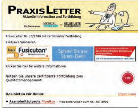
Premiumbanner 165 x 60