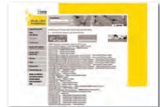
Wallpaper 728 x 90 und (120)160 x 600