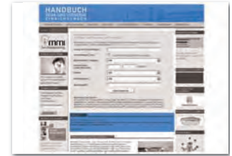
Presstext max. 2.500 Zeichen