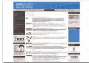
Rubrikenbanner 156 x max. 180