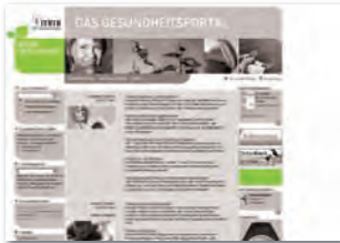
Drittelbanner 156 x 60 Rotation