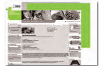
Wallpaper 728 x 90 und (120)160x 600