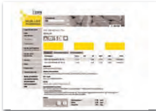
Drittelbanner 156 x 60 Arzneimittel-Datenbank