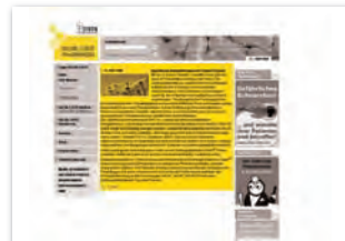
Presstext Plus max. 3.200 Zeichen