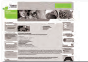
Halfsize-Banner 234 x 60