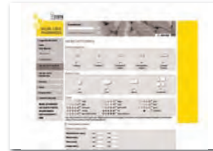
SkyScraper 120(160) x 600