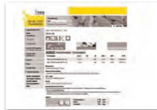
Fullsize-Banner 468 x 60