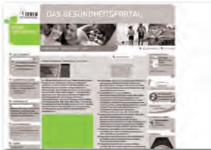
Content AD 300 x 200