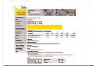
Fullsize-Banner 468 x 60 Arzneimittel-Datenbank