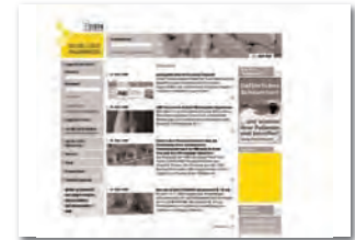
Ad-News 156 x max. 180