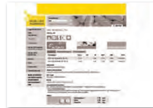
Superbanner 728 x 90