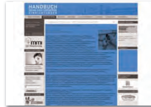
Themenbox 156 x max. 180