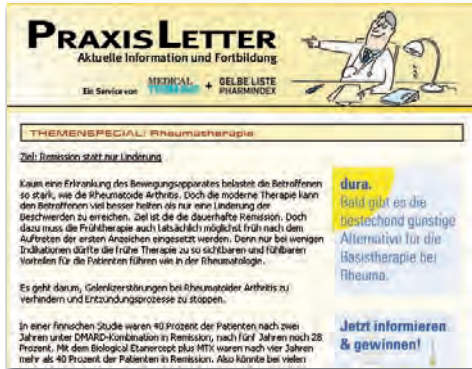
Themen-Spezial groß max. 3.200 Zeichen