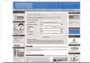
Banner 156 x 60 Rotation