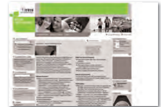
Superbanner 728 x 90