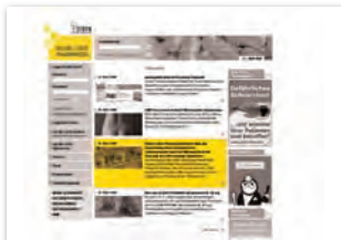
Presstext max. 1.000 Zeichen