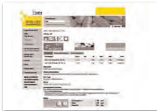
Halfsize-Banner 234 x 60