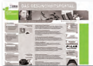
SkyScraper 120 x 600